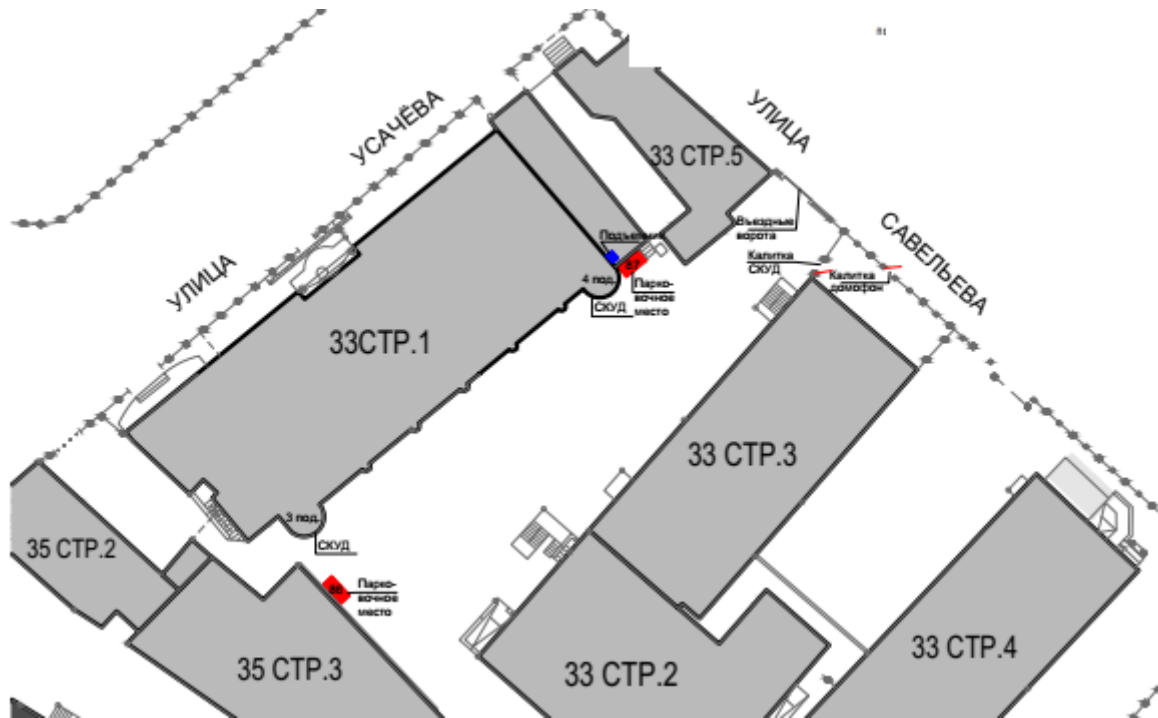
СХЕМА прохода к месту размещения БОКСа и месту парковки транспортных средств по адресу: 119048, г. Москва, ул. Усачева, д.33, стр.1

Генеральный директор ООО УК «МНПО «СПЕКТР» (Д.У.)